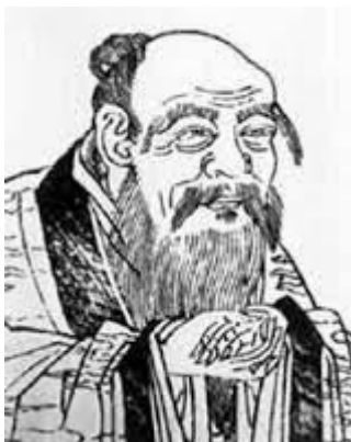
老子 Lǎo zǐ

Zudem soll die Praxis der einheimischen Glaubenssysteme die nationale Identität der Bürger verstärken.